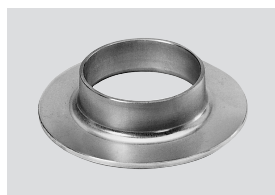
Bördel / collerette siehe Seite 74+75 voir page 74+75